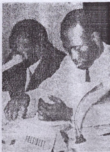
Le Secrétaire Général de l'O.U.A. M. Diallo Telli

Hier les séances de travail ont repris dans l'après-midi dans la salle du 2 octobre. Aujourd'hui, samedi 13 janvier, le Chef de l'Etat, le Président Ahmed Sékou Touré, en compagnie des membres du BPN et du Gouvernement, offrira, en